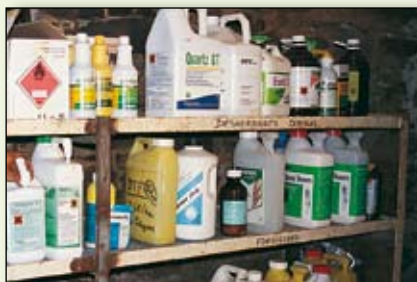
Toutes les idées pour réaliser votre local phyto à moindre coût