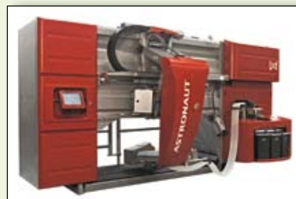
2 robots de traite en démonstration