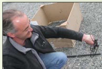
L'association des piégeurs à votre service